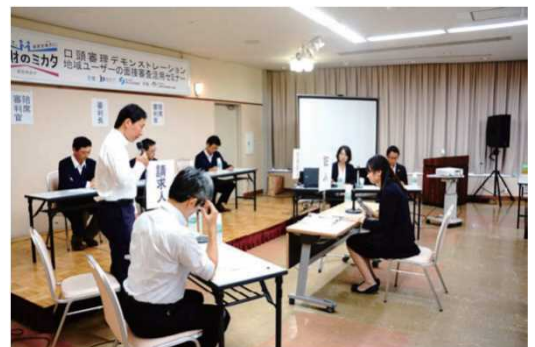
<模擬口頭審理の様子>